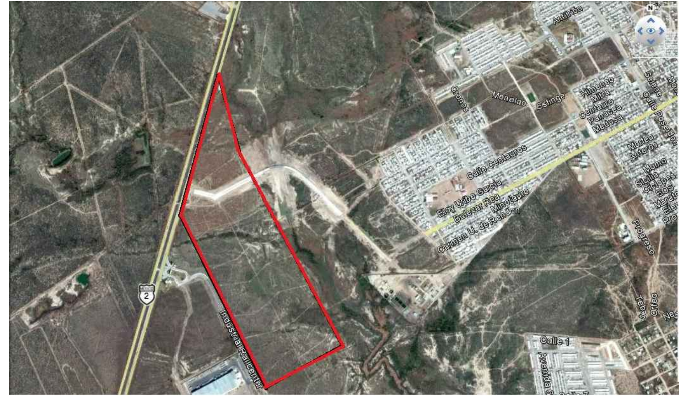
2 VISTA AEREA DEL TERRENO SIN ESCALA.